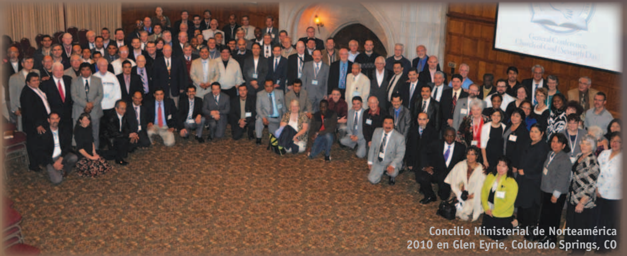
Concilio Ministerial de Norteamérica 2010 en Glen Eyrie, Colorado Springs, CO