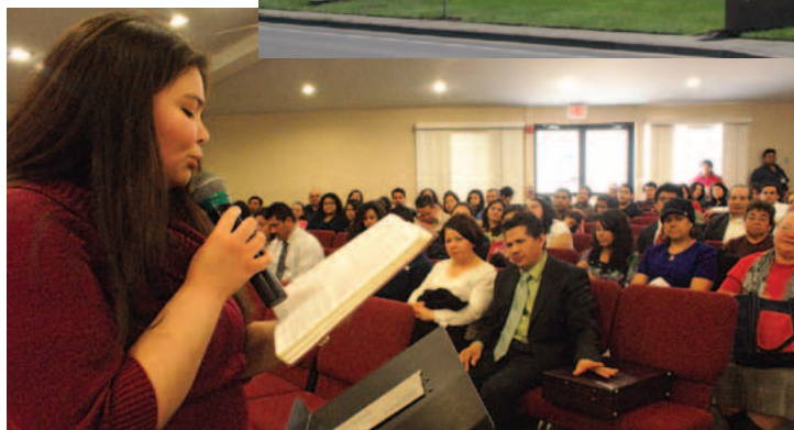
Las iglesias de Lanham, MD, y San Diego, CA han leído de la Biblia conmemorativa en sus servicios. A la izquierda: un miembro de Lanham lee de Juan 17- el día 26 de marzo de 2011.