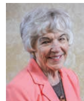
Hope Dais Corrección de Estilo