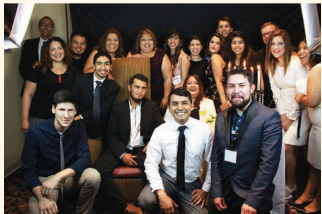
Los jóvenes adultos disfrutaron de la comunión con amigos nuevos y viejos en la convención. El jueves en la tarde se reunieron para su cena de Gala Blanco & Negro.